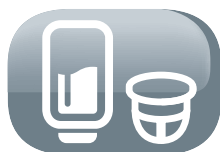
Filtro de depósito