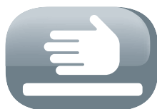
Tapa superior de seguridad