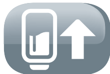
Depósito de combustible extraíble