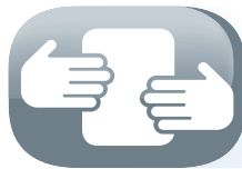
Easy to move