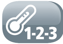
3 Heating settings